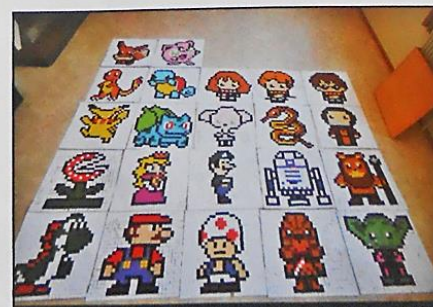
Un collège + 11 classes + 20 enseignants(fois) + 200 élèves + 15 000 Pixels = Une école où il fait bon VIVRE ENSEMBLE. Le vendredi 19 août, s'est déroulée la traditionnelle Journée d'accueil du collège jaune de Fleurier.