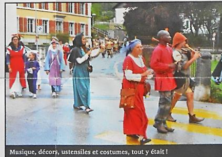
Musique, décors, ustensiles et costumes, tout y était !

événements avec leur association médiévale fantastique. Fondée en 2014, la Guilde de Sombre-Sang a compté dans ses rangs deux Bayardins. Ils ne sont pas étrangers à la première venue de la compagnie sur le sol butteran. Parmi leurs atouts, ils sont capables aussi bien de proposer du tir à l'arc aux enfants, de raconter des contes musicaux et de faire des démonstrations de cuisine avec des techniques d'époque. Ce fumet que j'ai senti précédemment sortait de deux de leurs marmites. « C'est roast-beef en croûte de sel aujourd'hui, vous restez manger ? »