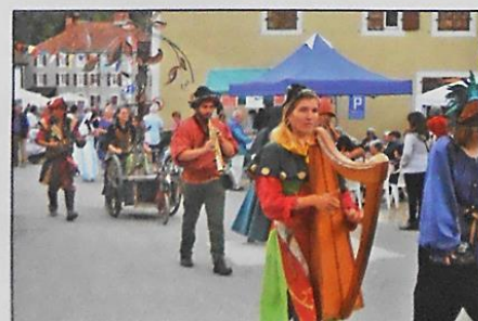
Malgré le temps pluvieux, le cortège a été très majoritairement apprécié par les spectateurs.

La glace étant brisée, les jeunes femmes m'expliquent qu'elles participent à différents