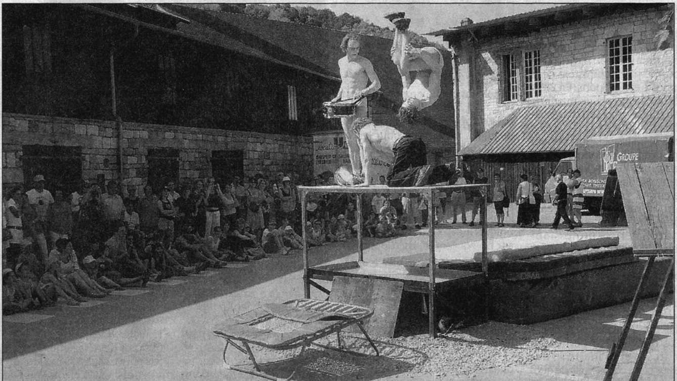
Les acrobaties des Urbaindigènes ont enthousiasmé le public